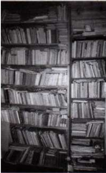
Knygnešio Juozo Petrulio asmeninės bibliotekos fragmentas.

tą geografijos pamoką irgi žinojau atsakymus į pateiktą užduotį, nes prieš tai, daug kartų persinešęs į namus pasiskolintą geografijos vadovėlį, kadangi nuosavo neturėjau, vakarais prie menkos spingsulės žodis į žodį, į kelis įvairaus formato ir storio sąsiuvinius buvau visą jį persirašęs. Pokario metais nebuvo nei parkerių, nei šratinukų. Rašydavome įstatyta į